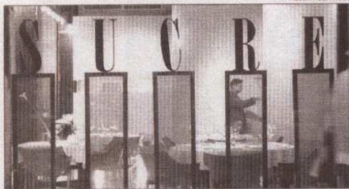
Escondido tras la erre, Guillem Vicente prepara la noche. A la derecha, Butrón y su equipo (detrás, Xano Saguer).