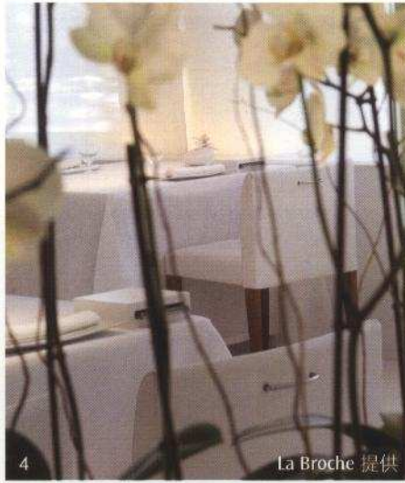
4. La Broche 提供