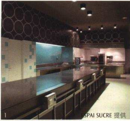
1. ESPAI SUCRE 提供